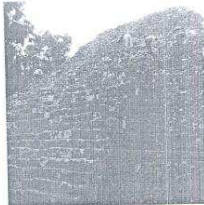
Foto 1. Edificio 152 de la Plaza C durante la realización de trabajos de desyerbe a causa del crecimiento de la vegetación