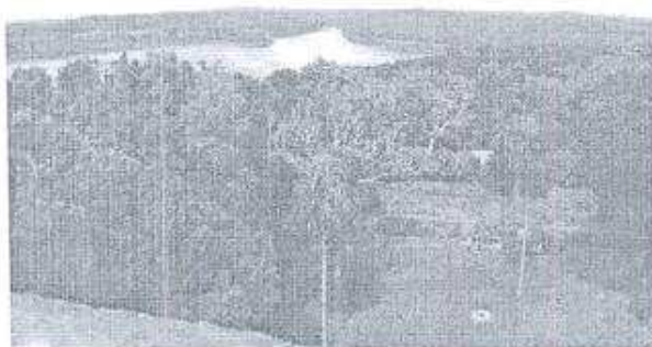
Foto 4. Vista parcial del entorno de la Acrópolis Este desde el Edificio 216 mientras se verificaban las ramas que fuera necesario cortar.