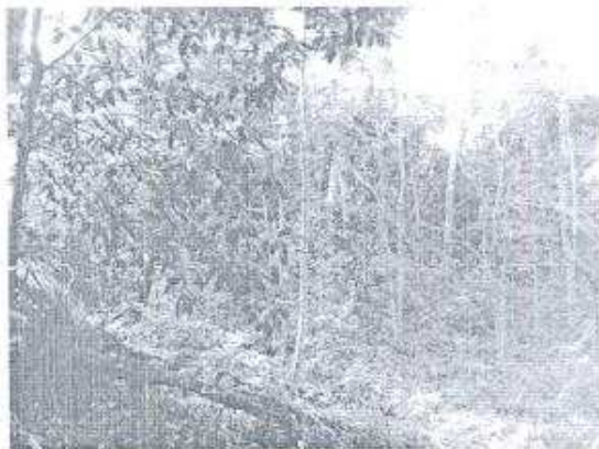
Foto 7. Se espera desarrollar un programa de monitoreo y mantenimiento de los sitios arqueológicos