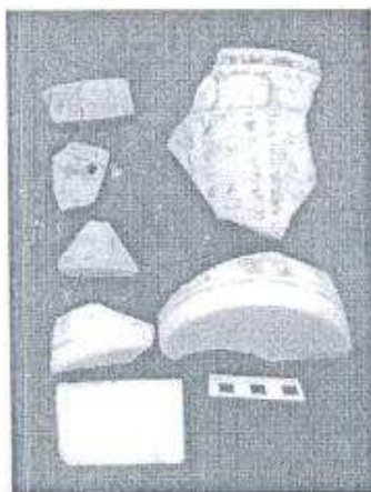
Foto 6. Fragmentos de cerámica del Grupo cerámico Zacatal, Topoxte