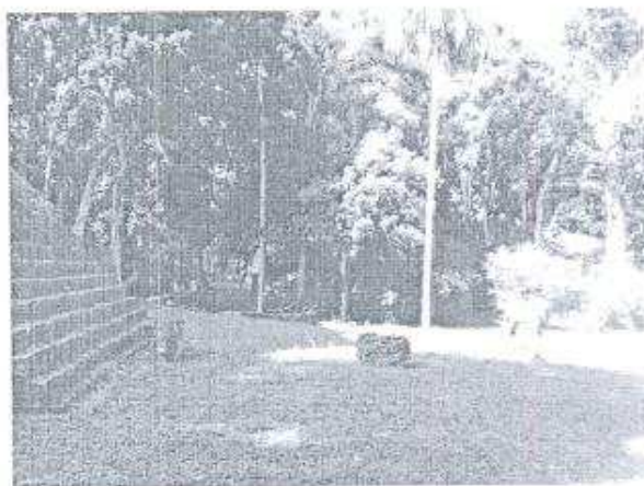
Foto 3. Vista de la plaza de La Acrópolis Este, lugar visitado por la delegación de JICA como parte de su visita de campo