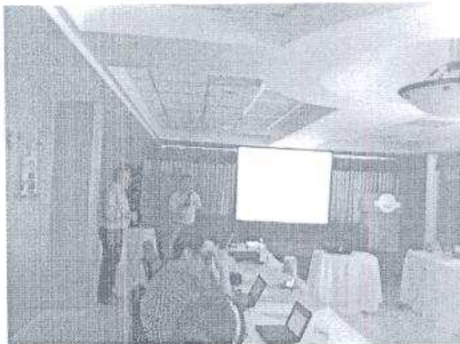
Foto 5. Se han tratado durante las reuniones temas de suma importancia que derivará en acciones concretas orientadas a optimizar la protección y conservación del parque.